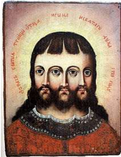
Икона: «Троица смес-о-ипостасная»: 1729

http://exeget.panikarolinka.ru/misc/smesoiops.html https://commons.wikimedia.org/wiki/File:Троица_1729.jpg